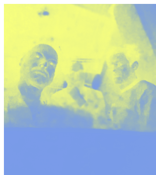
20:00 THE GREEN CAT